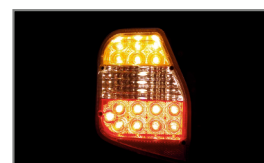
FEUX ARRIÈRE À LED TENDANCES ET LUMINEUX