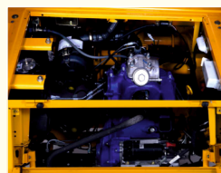
ACCÈS BI-DIRECTIONNEL FACILE ET CONFORTABLE AU COMPARTIMENT MOTEUR