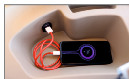
PORT USB POUR CHARGEMENT EN DÉPLACEMENT