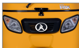
PHARES DOUBLE ÉLÉGANTS ET SPORTIFS