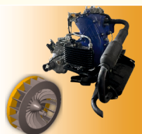
AVANCÉ et PUISSANT MOTEUR 8,60 kW (11,5 ch) AVEC VENTILATEUR DE TYPE SOUFFLEUR