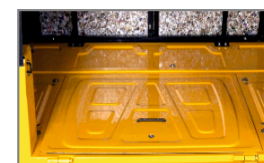
LE MEILLEUR ESPACE À BAGAGES DE SA CATÉGORIE