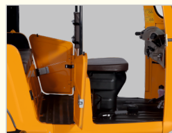
ESPACE PILOTE ET PASSAGER SPACIEUX ET CONFORTABLE

Note: Les photos présentées dans ce tableau, les spécifications techniques, les accessoires et l'équipement sont à des fins indicatifs seulement. cela peut ne pas faire partie du montage standard. atul auto limited se réserve le droit de modifier les spécifications et caractéristiques techniques sans préavis.