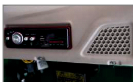
LE MEILLEUR SYSTÈME MUSICAL DU SEGMENT