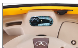
TABLEAU DE BORD BEIGE ATTRAYANT & MAJESTUEUX