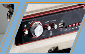
SISTEMA DE AUDIO BLUETOOTH / USB