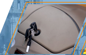
GUANTERA CON LLAVE