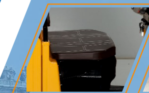
NUEVO ASIENTO ERGONÓMICO EXTENDIDO