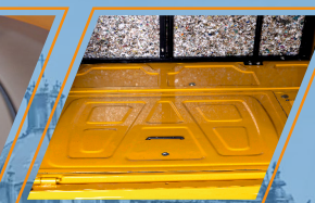
AMPLIO PORTA EQUIPAJE