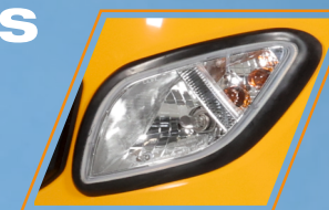
FAROS DE HALÓGENO